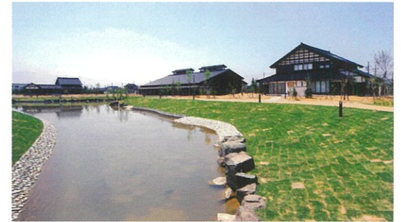
도로물못에서 본 토나미 산거마을 박물관

토나미평야의 산거마을 경관은 일본의 벼농사 농촌을 대표하는 경관의 하나라고 말해집니다. (토나미 산거마을 박물관)은 그 경관을 보존하는 것이나, 이 지방에 전해지는 전통 문화를 전국에 발신해 지역의 활기를 창출하기 위해서 토나미 노다원공간 박물관의 거점 시설로서 정비되었습니다. 박물관의 부지내에는 정보관, 전통관, 교류관이 있어 산거 경관의 정보나 전통 문화의 매력에 접할 수 있다.