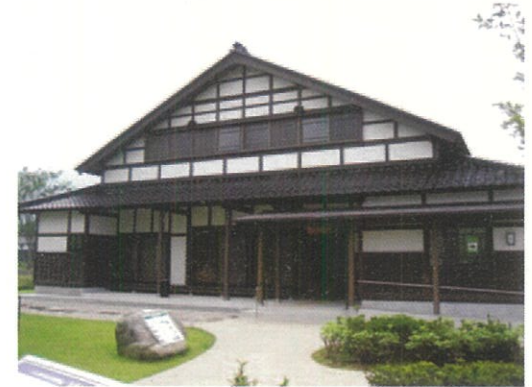
타카세 커뮤니티 시설 아즈마다치(東建)타카세