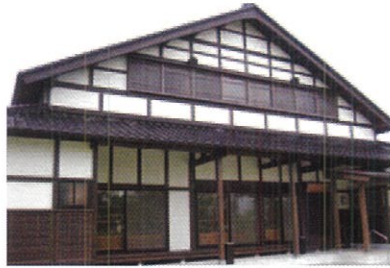
뱃집지방이 아름다운 아즈마다치의 정면

토나미평야에서도 많이 볼 수 있는 뱃집지방의 집은 동쪽을 향해 세우고 있는 것이 많아, 아즈마다치(동쪽 세우기東建)로 불리고 있습니다. 아즈마다치는 에도막부 말기부터 볼 수 있었고, 메이지 말기에는 기와의 보급과 함께 일반화되었으며, 쇼와 30년대까지는 일종의 스테이더스로서(제급의 영광으로) 번영했습니다.