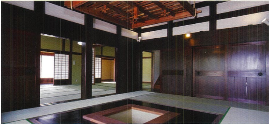
이벤트나 갤러리라 등으로해서 다채롭게 사용할수 있는 거실