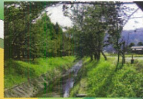
권 행사천 아즈마다치(東建)타카세의 경을 흐르는 권행사천에는(권 행사에는 6~7월에 환상적인)환상적인 만갯물이 읊을주는 것을 볼수 있습니다.