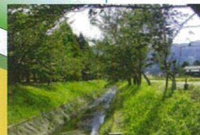
かんきょうじがわ 勸行寺川 あずまだち高瀬の側を流れる勸行寺川では、6～7月にかけて幻想的なホタルの乱舞が見られます。