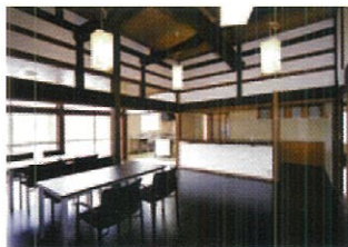
カウンター・ラウンジ