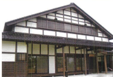
切妻屋根が美しいアズマダチの正面

砺波平野でも多く見られる切妻屋根の家は東を向いて建っていることが多く、アズマダチ(東建ち)と呼ばれています。アズマダチは幕末から見られ、明治末期には瓦の普及とともに一般化し、昭和30年代まで一種のステータスとして栄えました。