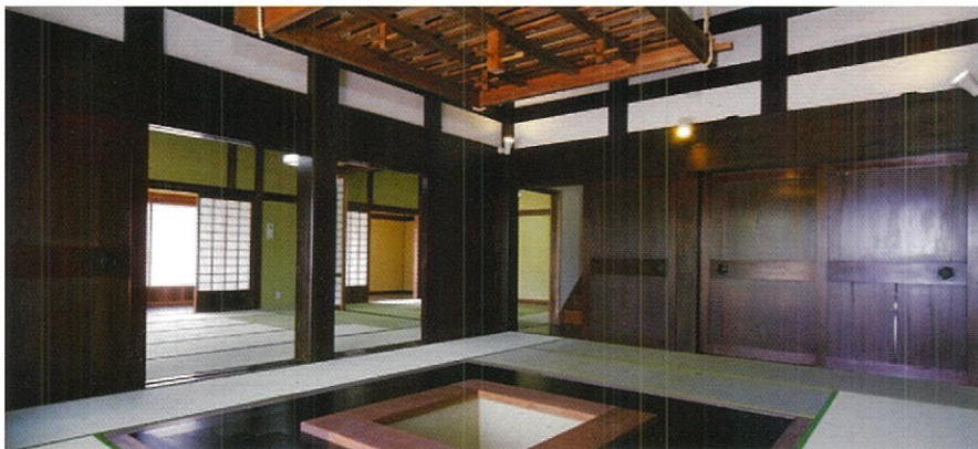
イベントやギャラリーとしても多彩に使用できる広間