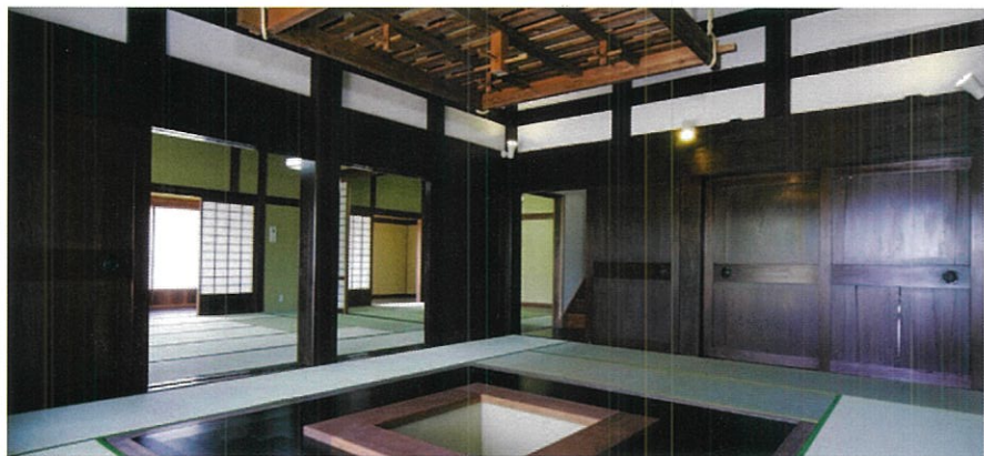
適用於各種活動和美術展覽等豐富多彩的大廳