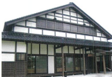
切妻屋頂最美麗的東建正面

在礪波平原裏能看到大量八字型屋頂的房子大多數都朝向東方而建成的，因此被稱為azumadachi(東建)。azumadachi(東建)從幕府末期就看得見，但到了明治末期、因屋頂瓦片的普及而一般化，再到昭和30年代則成為顯示社會地位的象徵。