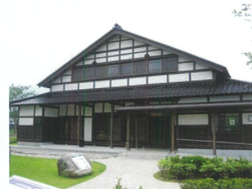
高瀨地方自治社區交流中心 東建(azumadachi)高瀨