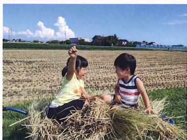
となみ野歳時記賞「お米いっぱい食べるぞ」