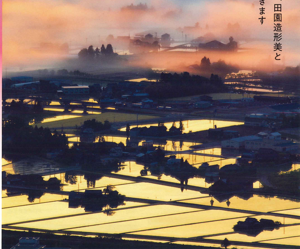
散居村大賞「夢幻の朝」